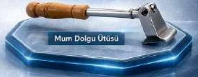
Mum Dolgu Ütüsü