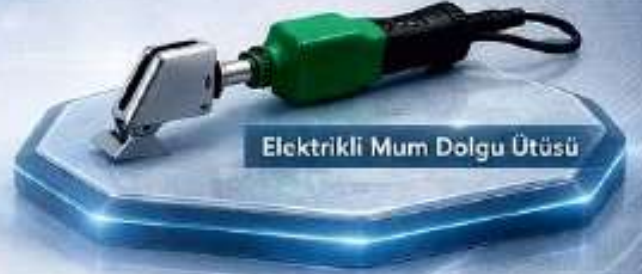
Elektrikli Mum Dolgu Ütüsü